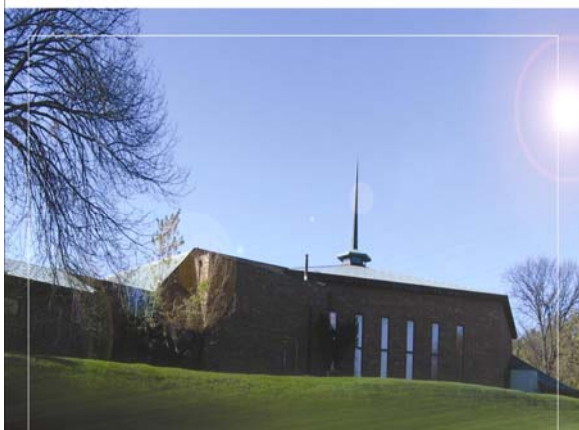
敬拜禱告中心 Worship and Prayer Center (WPC)

若您願意以奉獻捐助方式參與此修復計劃，支票請寄至 CASC，並註明“教堂屋頂修復計劃”。郵寄地址：23W420 St. Charles Road, Carol Stream, IL 60188。詳情詢問請電郵 lien.tai@villark.com 或電話聯絡 (847)924-3332。